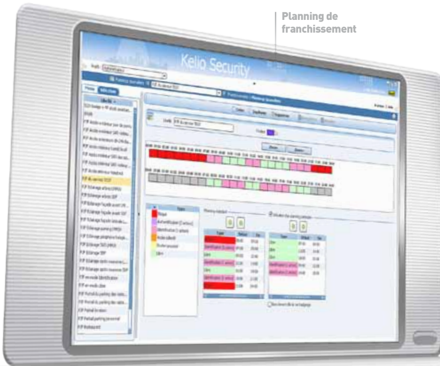
Planning de franchissement