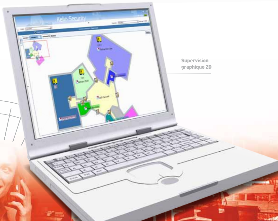
Supervision graphique 2D

Gestion jusqu'à 5000 personnes avec la possibilité de personnaliser tous les droits et autorisations.